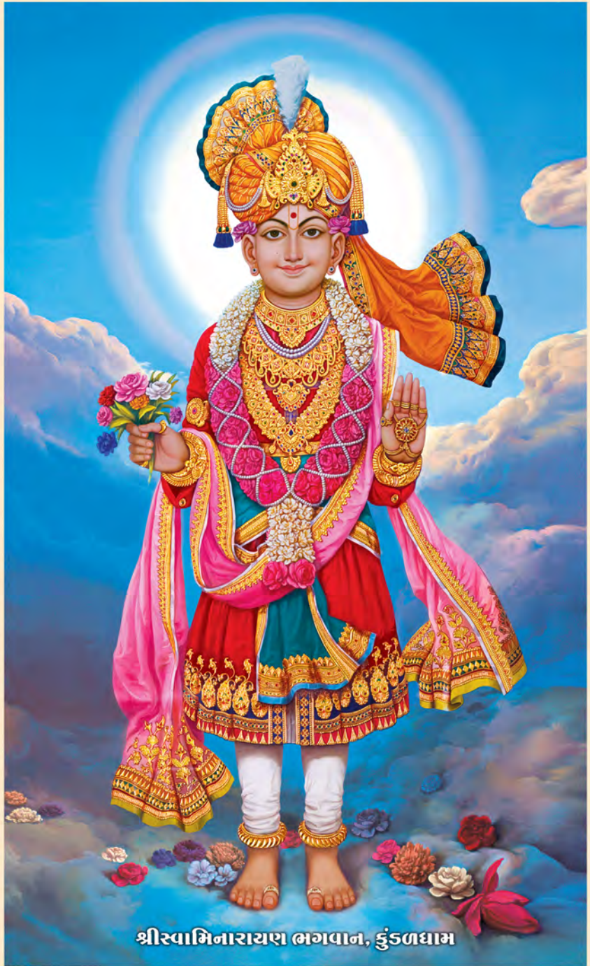
श्रीस्वामिनारायण भगवान्, कुंडलघाम