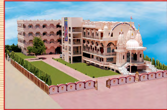
શ્રીસ્વામિનારાયણ મંદિર - કારેલીબાગ