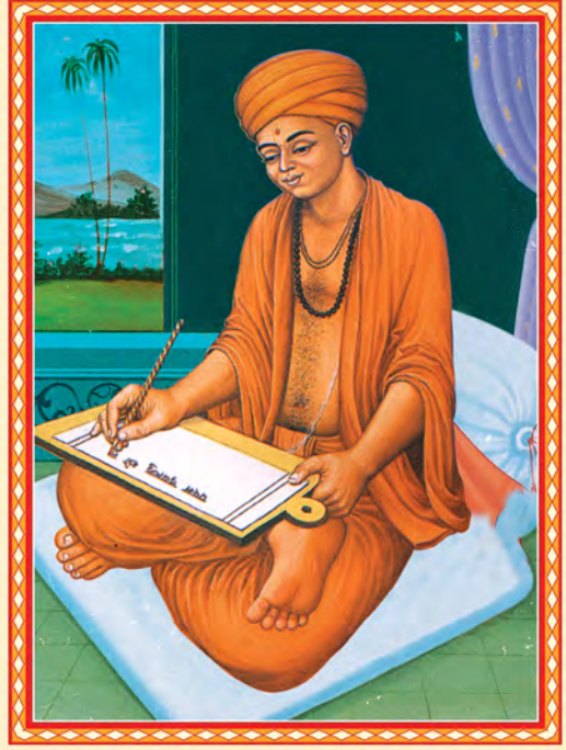
વૈરાગ્યમૂર્તિ સદ્. શ્રીનિષ્કુળાનંદસ્વામી

ત્યાગ ન ટકે રે વૈરાગ્ય વિના, કરીયે કોટિ ઉપાયજી; અંતર ઊંડી જે ઈચ્છા રહે, તે તો કેમ તજાયજી. વેશ લીધો વૈરાગ્યનો, દેશ રહી ગયો દૂરજી; ઉપર વેશ અચ્છો બન્યો, માંહી મોહ ભરપૂરજી. કામ ક્રોધ લોભ મોહનું, જ્યાં લગી મૂળ ન જાયજી; સંગ પ્રસંગે તે ઉપજે, જ્યારે જોગ ભોગનો થાયજી. પળમાં જોગી પળમાં ભોગી, પળમાં ગૃહી ત્યાગીજી; નિષ્કુળાનંદ કે એ નરનો, વણસમજ્યો વૈરાગ્યજી.