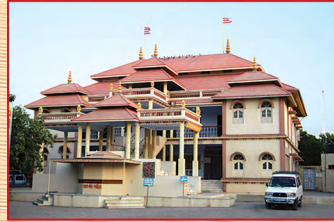
શ્રીસ્વામિનારાયણ મંદિર - કુંડળધામ